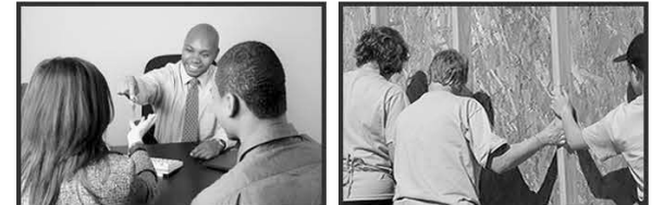
Las primeras tres fotografías tomadas por David Y. Lee para el Fortune Society

¡El Reingreso de prisioneros nos afecta a todos!